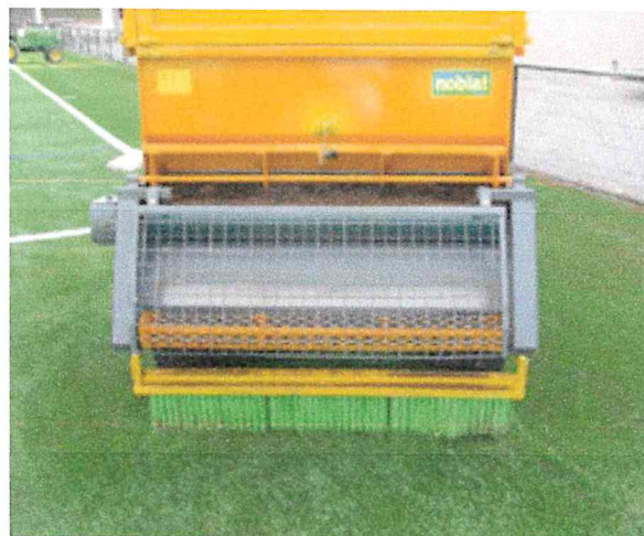
Particolare tramoggia per stesura di Infillpro Geo