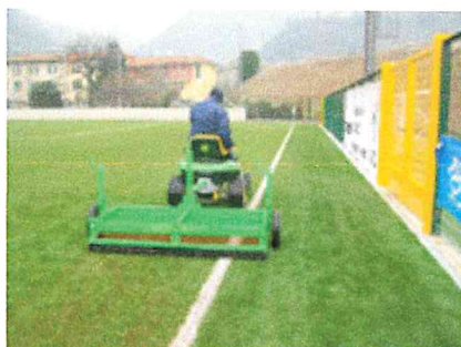
Spazzolatura con pettine a traino