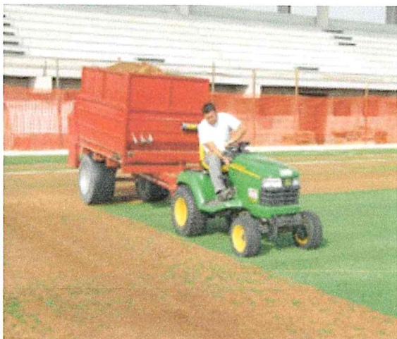
Operazione di stesura di Infillpro Geo