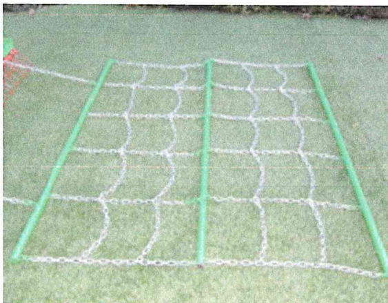
Operazione di compattazione con rete geoa