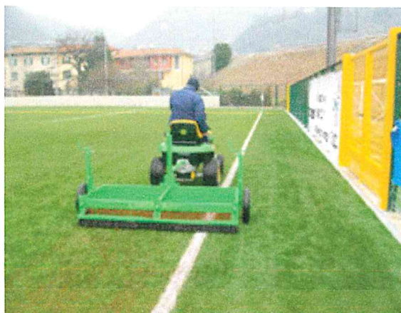
Operazione di de compattazione/spazzolatura