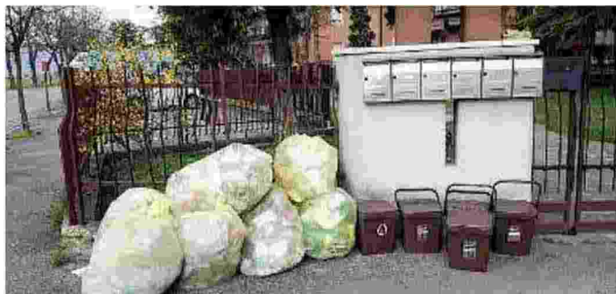
La raccolta. Lo scopo è ridurre i sacchi a domicilio, incentivando la raccolta