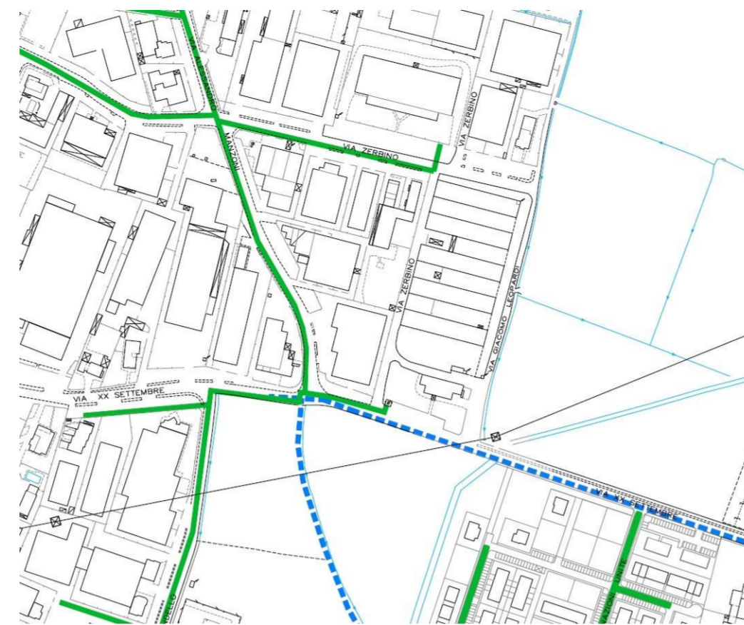
ESTRATTO PGT PdS - Tav 4c - Rete metanodotto Scala 1:5000